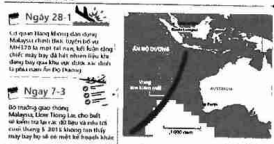
Hình 1. Hành trình tìm kiếm máy bay MH370 mất tích bị ẩn năm 2015. TTO, 08/03/2016

Qua hình 1 ta có thể thấy sự kết hợp giữa bản đồ và hình vẽ, chữ viết nhằm để làm rõ nét các yếu tố được nhắc đến trong hình. Phần chú thích rõ ràng, ngắn gọn chứa đựng đầy đủ nội dung thông tin giúp công chúng tiếp nhận nhanh hơn.