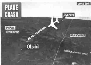
Hình 2. Máy bay Indonexia rơi

Tuổi trẻ Online thường dẫn lại tin đồ họa từ một số nguồn uy tín như: CNN, BBC, Reurter