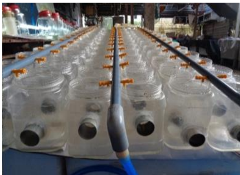
Hình 3. Hệ thống sử dụng kích thích sinh sản vọt

Thời gian hiệu ứng (phút): Được tính từ khi bắt đầu sử dụng hoặc áp dụng các phương pháp tác động đến khi quan sát thấy vọt cái phóng trứng và vọt đực phóng tinh trùng trong môi trường nước.