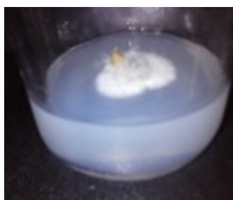
Hình 1. Đoạn cành mang mắt ngủ được khử trùng bằng NaOCl 7% bị nhiễm nấm sau 1 tuần nuôi cấy

Ghi chú: Bảng kết quả dựa trên số liệu được thu thập sau 8 tuần nuôi cấy