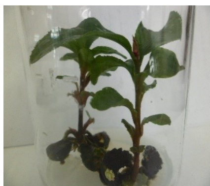
Hình 2. Cây nảy mầm từ hạt trà hoa vàng được khử trùng bằng NaOCl 7% sau 12 tuần nuôi cấy