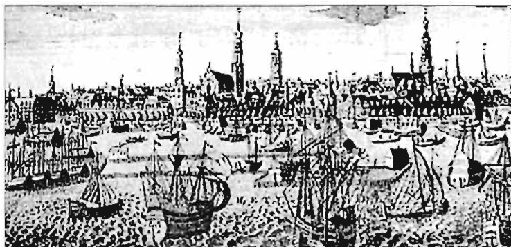
Hình 2. Một góc hải cảng Am-xtéc-đam thế kỉ XVII

Cách mạng Hà Lan thắng lợi, chế độ thống trị của phong kiến Tây Ban Nha ở Nê-đéc-lan bị lật đổ, mở đường cho chủ nghĩa tư bản phát triển. Việc sản xuất trong các ngành nghề dệt len, dệt vải, nhuộm, in, thủy tinh và chế tạo kính quang học... được đẩy mạnh. Thương nghiệp phát triển, nhiều tàu thuyền của Các tỉnh Liên hiệp hoạt động nhộn nhịp trong và ngoài nước. Vào đầu thế kỉ XVII, Am-xtéc-đam có đến 10 vạn dân, tiếp nhận hàng nghìn tàu thuyền thường xuyên ra vào cảng, buôn bán với các nước Anh, Pháp, Nga, Ấn Độ... Các công ti thương mại của Hà Lan như: “Công ti Phương Đông”, “Công ti Đông Ấn”... không chỉ mở rộng việc buôn bán với nhiều nước trên thế giới mà còn tiến hành việc xâm chiếm thuộc địa. In-đô-nê-xi-a trở thành thuộc địa lớn nhất của Hà Lan.