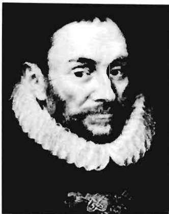
Hình 1. V. Ô-ran-giơ (1533 - 1584)

Quý tộc lớp trên của Nê-đéc-lan, được sự giúp đỡ của nước ngoài, lập một đội quân đánh thuê đưa về nước để lật đổ ách thống trị Tây Ban Nha, song bị đánh tan vào năm 1568.