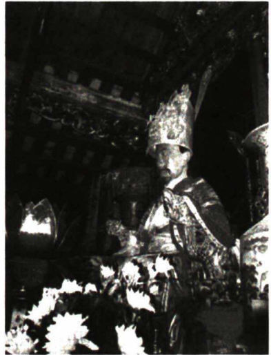
Tượng thờ Ngô Quyền ở Đường Lâm (Sơn Tây, Hà Nội)

Năm 950, Dương Tam Kha sai Ngô Xương Văn, Dương Cát Lợi, Đỗ Cảnh Thạc đem quân đi đánh hai thôn Đường và Nguyễn ở Thái Bình (vùng đất Sơn Tây, Hà Nội ngày nay). Ngô