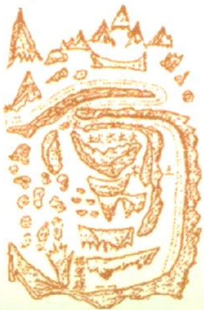
Mộ Hàn Tín (Hán)