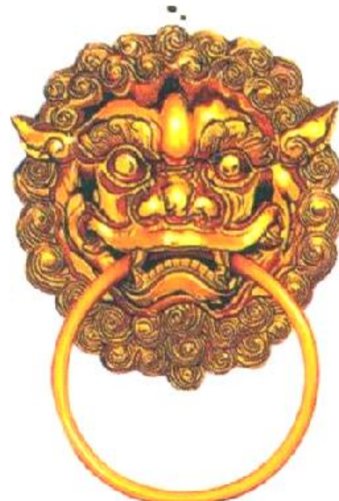
Khoen cửa nạp phúc