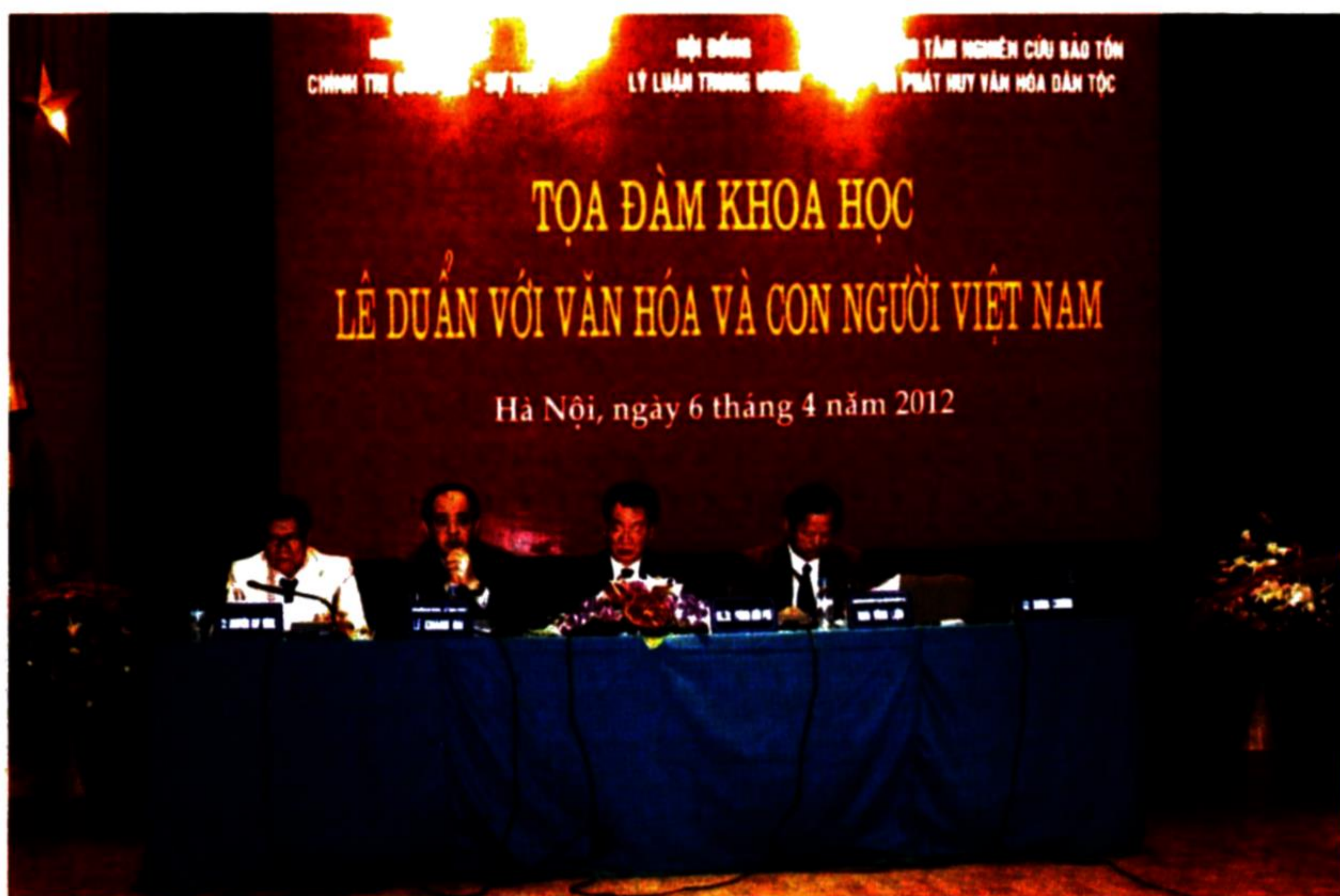
Đoàn Chủ tịch tọa đàm khoa học “ Lê Duẩn với văn hóa và con người Việt Nam ”.