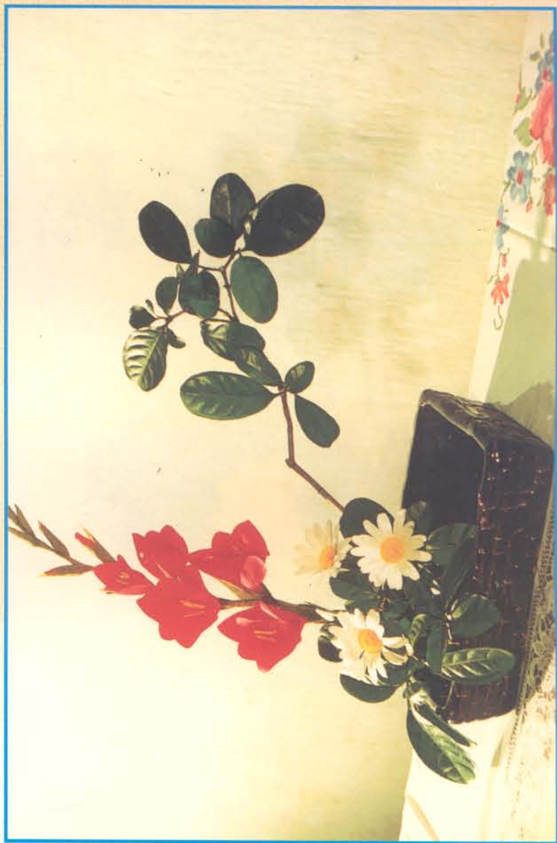
GLADIOL & CÚC TRẮNG