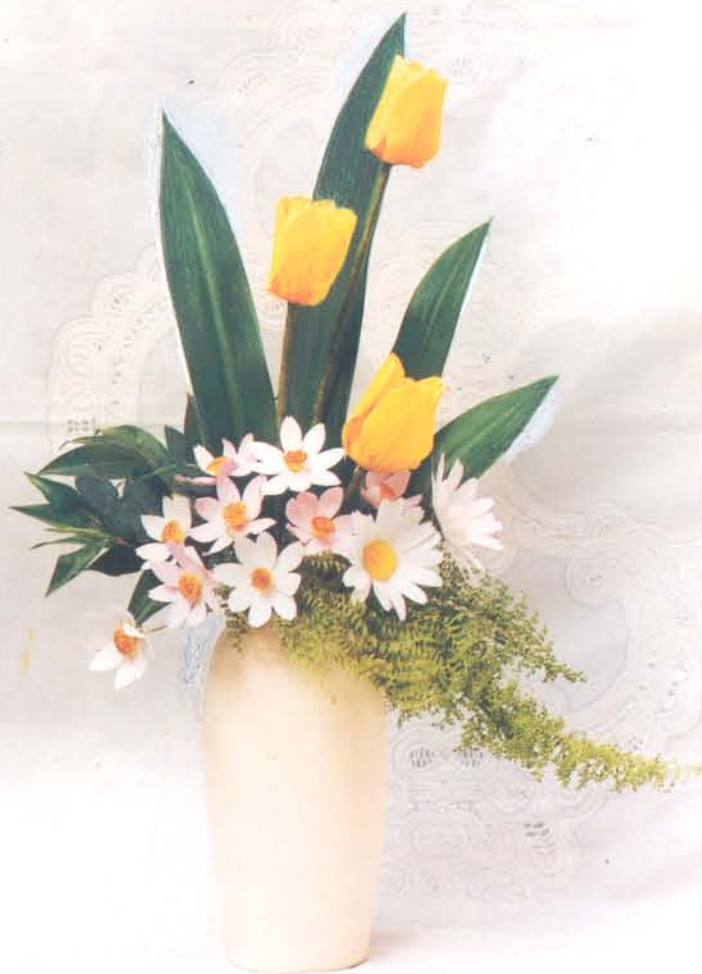
SAO NHÁI & TULIPE