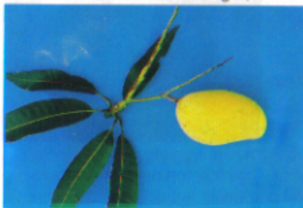
Giống xoài GL1

Cây sinh trưởng, phát triển khoẻ, tán tròn đều, phân cành khoẻ. Hoa nở vào cuối tháng 3, đầu tháng 4. Thời gian từ đậu quả đến thu hoạch 120-130 ngày. Quả nặng trung bình 220g/quả. Khi chín vỏ quả màu vàng sáng, có mùi thơm và ngọt đậm.