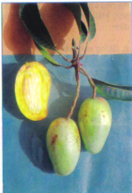
Giống xoài Vân du

Giống ít phân cành, tán thưa, thoáng. Hoa nở tập trung vào tháng 4. Quả to. Mỗi chùm hoa để một quả, khối lượng quả trung bình 800 - 900 g/quả. Thịt quả màu vàng, vị ngọt đậm.