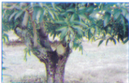
Đốn tỉa trẻ lại sau 15 năm

Sau khi trồng thân chính cao 60 - 70cm thì bấm ngọn để 4 cành cấp 1 ở bốn hướng. Khi cành cấp 1 dài 40 - 50cm thì bấm ngọn. Mỗi cành cấp 1 để lại 2-3 cành cấp 2. Khi