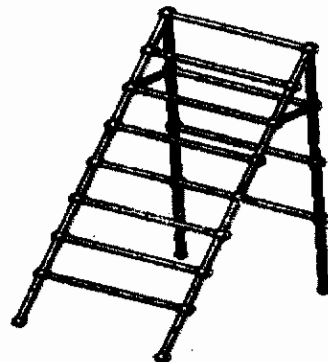
Mô hình phần tử hữu hạn