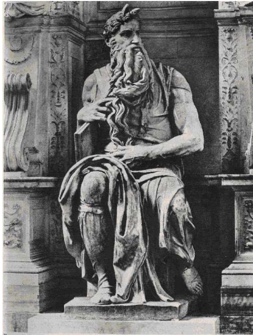
Môi-dơ (Tượng tròn, đá hoa cương của Mi-ken-lăng-giơ)