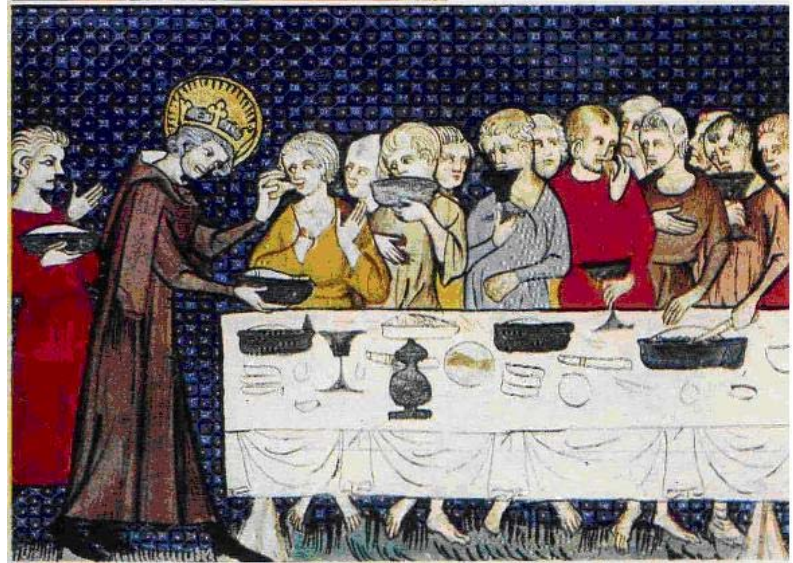
Tranh Thánh (nghệ thuật Trung cổ)