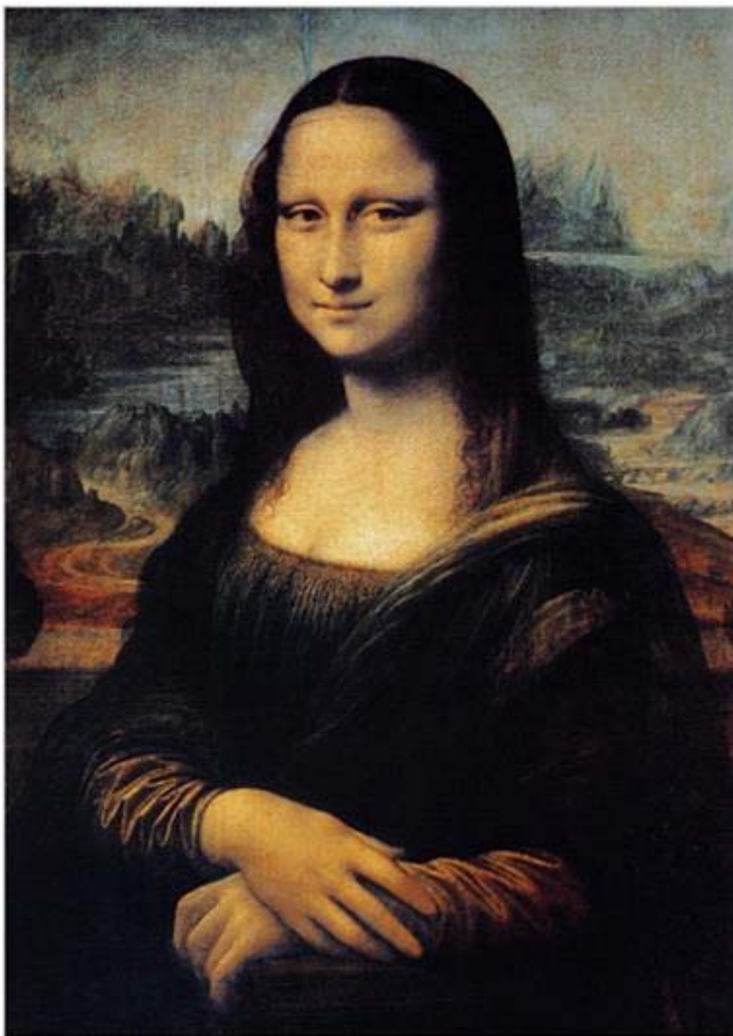
Chân dung La Giô-công-đơ (Tranh sơn dầu, 1503) của Lê-ô-na đờ Vành-xi