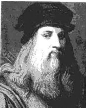
Chân dung họa sĩ Lê-ô-na đờ Vành-xi (Ảnh)