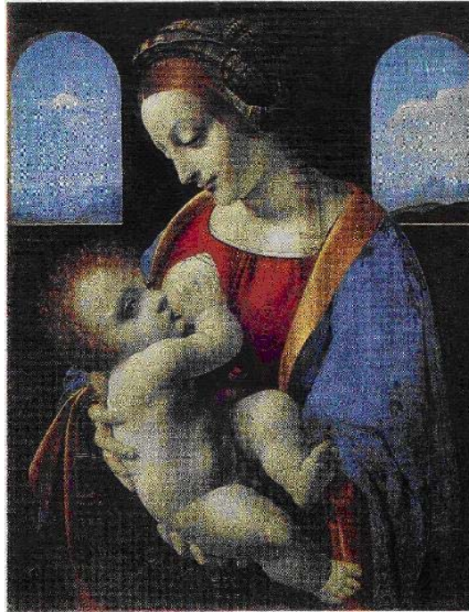
Đức mẹ và chúa hài đồng (tranh sơn dầu của Lê-o-na đờ Vành-xi)