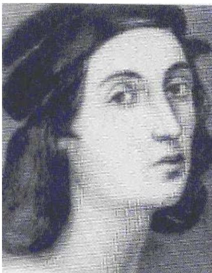
dung hoạ sĩ Ra-pha-en (Ảnh)