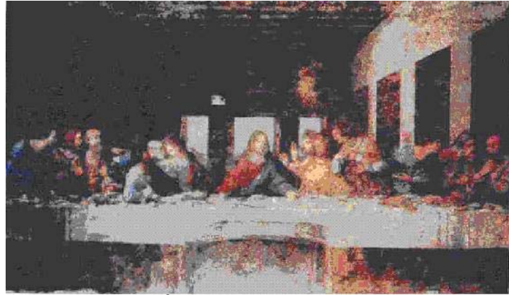
Bữa ăn cuối cùng (Tranh tường) của họa sĩ Lê-ô-na đờ Vành-xi

Lê-ô-na đờ Vành-xi là một trong những nhân vật vĩ đại nhất của thời Phục hưng. Ông là họa sĩ thiên tài, đồng thời là nhà điêu khắc, kiến trúc sư, nhạc sĩ, nhà toán học, nhà triết học, bác học toàn năng. Ngoài ra, ông còn có những công trình lí luận về hội họa, giải phẫu tạo hình, luật viễn cận, quân sự, xây dựng, công nghệ và là người đầu tiên tìm ra “cái hộp tối” mở đầu cho kĩ nguyên nhiếp ảnh.