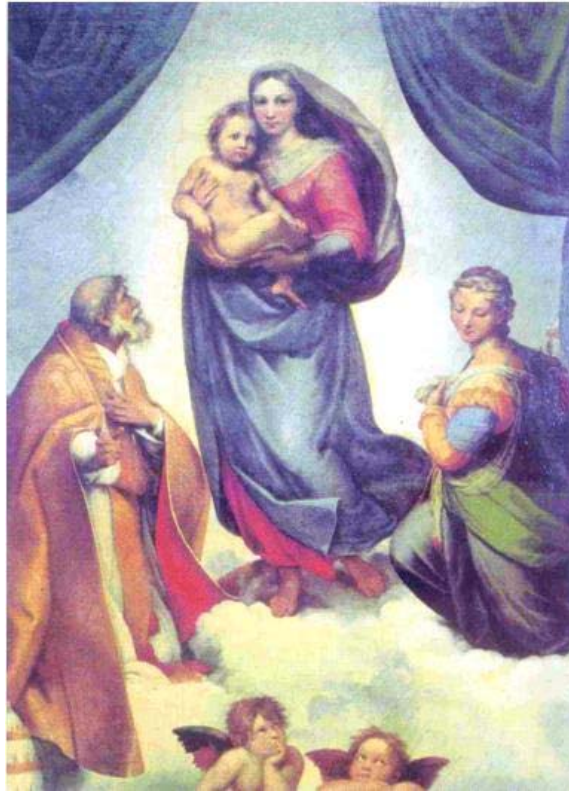
Đức mẹ ở nhà thờ Xích -xtin (tranh sơn dầu) của Ra-pha-en