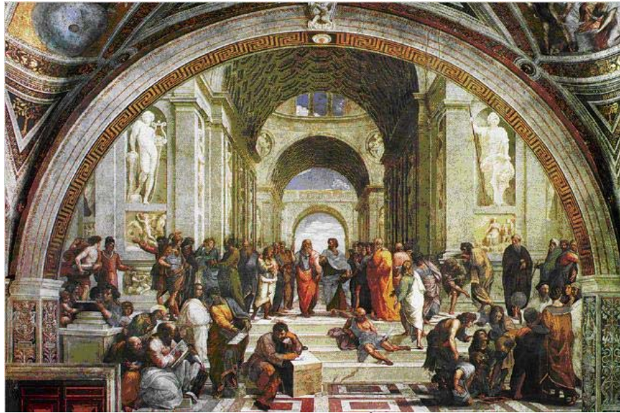
Trường học A-ten (tranh sơn dầu ) của Ra-pha-en

Toàn bộ pho tượng là nhân vật Đa-vít ở tư thế trước giờ giao chiến, từng bắp thịt nhỏ trên cơ thể Đa-vít cũng như cái nhìn quả cảm, xét đoán tình thế đều thể hiện được hình tượng người dũng sĩ đầy sức mạnh, có vẻ đẹp hùng dũng. Mọi tỉ lệ cơ thể của pho tượng đều là mẫu mực về giải phẫu cơ thể, thể hiện sự hoàn chỉnh giữa nội dung và hình thức trong một tác phẩm nghệ thuật.