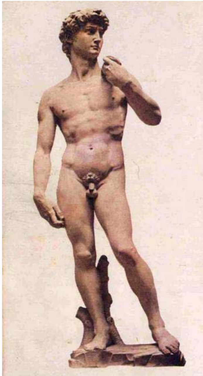
Đa-vít (Tượng đá cẩm thạch, 1501-1505) của Mi-ken-lăng-giơ

thế giới nội tâm phức tạp. Mô-na Li-da mặc chiếc áo màu sẫm, cổ mở tương đối rộng, hai bàn tay đặt hờ hững lên nhau ở phía trước, nét mặt hiền hậu, thông minh và nụ cười mỉm khó tả, nụ cười phảng phất dường như gợn sóng thoáng nhẹ trên mặt hồ, điểm vẽ xúc động mơ màng của tâm hồn, làm cho nhân vật trở nên sống động huyền bí. Nền tranh là phong cảnh bao la man mác với con đường, những lùm cây êm đềm, nhịp cầu nhỏ nhỏ, dòng nước uốn quanh,... không gian êm đềm đó đã tôn vẻ đẹp của nàng Mô-na Li-da lên, đồng thời như quyến luyến người đẹp, tạo nên một sự hài hoà tuyệt diệu giữa người và cảnh.