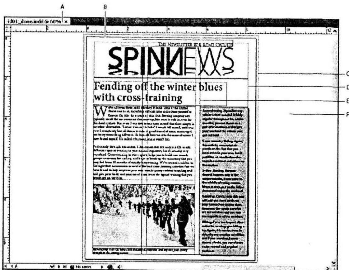
A. Cửa số tài liệu; B. Đường viền trang (các đường đen).; C. Các đường hướng dẫn Bleed (in chờm lên lè); D. Các đường hướng dẫn lè; E. Các đường hướng dẫn cột; F. pasteboard