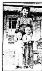
ẢNH KẾT THÚC