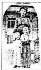
ẢNH BAN ĐẦU

Bằng sự kết hợp các công cụ và lệnh cơ bản có trong Photoshop, bức ảnh sau khi sửa sẽ đẹp mắt hơn trong thời gian thật ngắn.