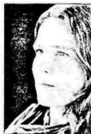
ẢNH KẾT THÚC