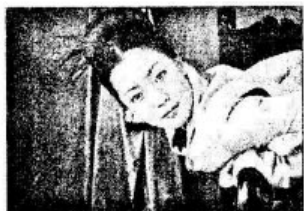
ẢNH BAN ĐẦU

Điểm nổi bật trong bài tập là sử dụng hiệu ứng Shadow Control tăng độ sáng và sắc nét cho ảnh. Kết hợp các công cụ, lệnh và bộ lọc trong Photoshop chỉnh sửa bức ảnh bắt mắt hơn.