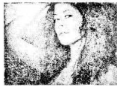
ẢNH KẾT THÚC 2