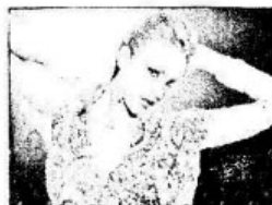
ẢNH KẾT THÚC