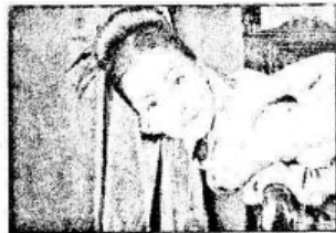
ẢNH KẾT THÚC