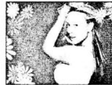
ẢNH KẾT THÚC