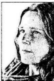
ẢNH BAN ĐẦU

Bài tập còn giới thiệu thủ thuật tăng độ sắc nét và làm mịn da, giúp bạn chỉnh sửa ảnh nhanh và dễ.