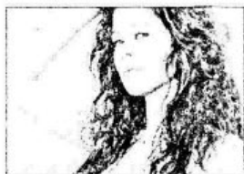
ẢNH BAN ĐẦU 1

Người học còn được hướng dẫn dùng Plug-in Neat Image làm mịn da nhanh chóng, kết hợp hiệu ứng Corel KnockOut 2 tách hình ra khỏi nền. Phần cuối bài tập hướng dẫn thao tác ghép ảnh.