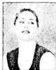
ẢNH KẾT THÚC