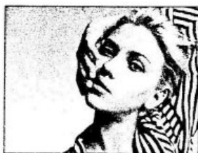
ẢNH BAN ĐẦU

Sau đó kết hợp các công cụ và lệnh trong Photoshop hiệu chỉnh màu cho bức ảnh.