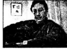
ẢNH BAN ĐẦU

Ngoài ra, bạn còn nắm được thủ thuật ghép tóc và áo sao cho đối tượng hài hòa với nhau. Mẫu áo sử dụng trong bài tập đã được xử lý trước.