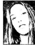
ẢNH KẾT THÚC