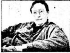
ẢNH CHỈNH SỬA