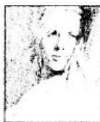
ẢNH BAN ĐẦU

Kết hợp các lệnh hiệu chỉnh màu trong chương trình Photoshop để có một bức ảnh bắt mắt hơn.