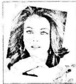
ẢNH KẾT THÚC