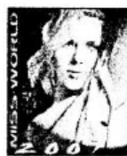
ẢNH KẾT THÚC