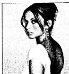
ẢNH BAN ĐẦU

Qua bài tập này, bạn sẽ nắm được thủ thuật chỉnh sửa ảnh tối, khai thác những công cụ để tạo hiệu ứng ánh sáng lên ảnh.