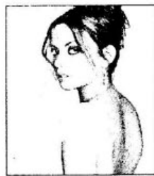
ẢNH KẾT THÚC

Sau đó trang trí cho bức ảnh mang tính nghệ thuật.