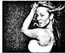
ẢNH BAN ĐẦU

Kết hợp các công cụ và lệnh trong Photoshop CS4 chỉnh sửa và trang trí cho ảnh bắt mắt hơn.