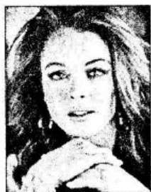
ẢNH BAN ĐẦU 1

Bạn có những bức ảnh đẹp, muốn sử dụng trong thiết kế hoặc xuất ảnh làm kỷ niệm nhưng kích thước lại nhỏ vì chụp bằng máy ảnh kỹ thuật số với độ phân giải thấp, hoặc chụp ảnh bằng camera của điện thoại di động. Plug-ins PhotoZoom Pro sẽ là một công cụ giúp bạn tăng kích thước cho ảnh một cách hiệu quả. Để bức ảnh đẹp mắt hơn, ngoài những thao tác chỉnh sửa, bạn cần có những ý tưởng thiết kế về bố cục, trình bày. Bài tập này, hướng dẫn bạn làm quen với giao diện PhotoZoom Pro và các thao tác chỉnh sửa ảnh, tạo hiệu ứng cuốn trang.