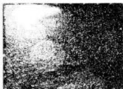
ẢNH BAN ĐẦU 2