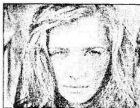
ẢNH BAN ĐẦU

Người học còn kết hợp các công cụ, lệnh trong Photoshop hiệu chỉnh độ mịn cho da và màu cho ảnh.