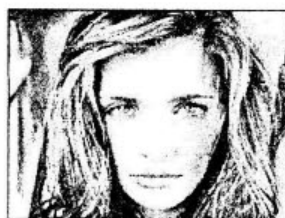
ẢNH KẾT THÚC