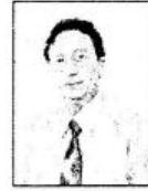
ẢNH KẾT THÚC