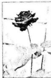
ẢNH BAN ĐẦU 2