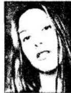
ẢNH BAN ĐẦU