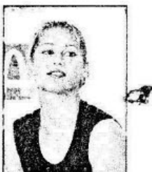
ẢNH BAN ĐẦU

Bài tập giúp bạn nắm được những thủ thuật chỉnh sửa ảnh bị bể nét.