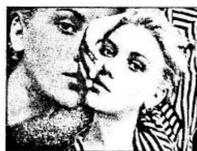
ẢNH KẾT THÚC