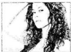
ẢNH KẾT THÚC 1