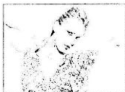
ẢNH BAN ĐẦU

Ngoài ra, Highlight Control Pro còn được dùng làm tối có chọn lọc trên toàn bộ ảnh.