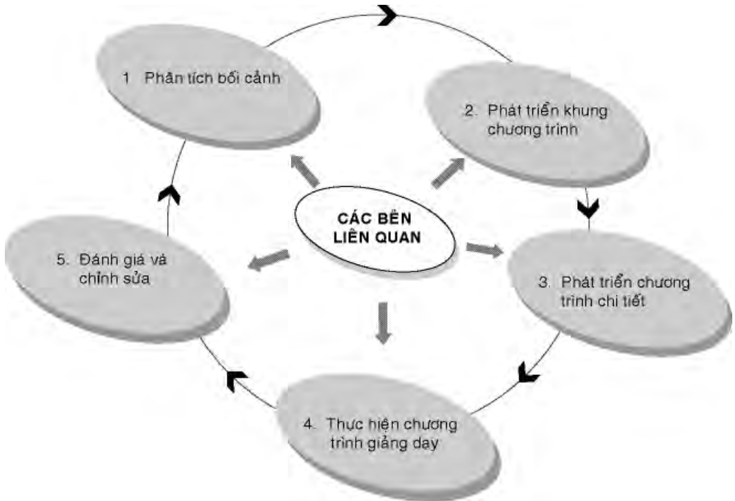
HÌNH 1 - Chu trình phát triển chương trình đào tạo có sự tham gia

triển chương trình đào tạo. Tuy nhiên, cần lưu ý là mức độ tham gia của các bên liên quan trong từng giai đoạn của chu trình cần được tổ công tác phát triển chương trình và chính các nhóm liên quan xác định.