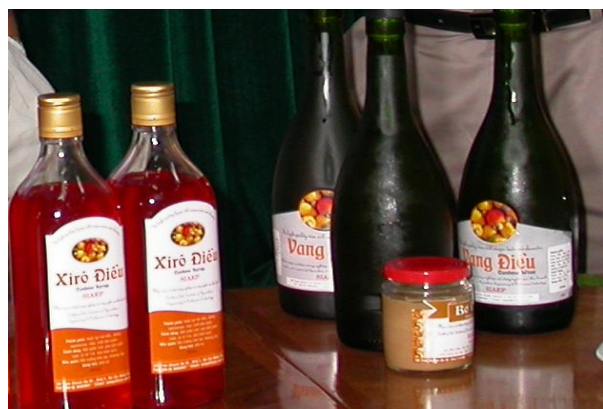
H 2: Xi-rô và rượu vang chế biến từ trái điều

Hiện nay mới có khoảng 10 nhà máy chế biến điều ở các vùng chuyên canh tập trung được đưa vào hoạt động nhưng các nhà máy này đều thiếu nguyên liệu phải nhập hạt điều thô từ các tỉnh khác và tình trạng tranh mua nguyên liệu vẫn xảy ra. Phần lớn các công ty chế biến mới được xây dựng vào khoảng những năm 2004-2005, một số công ty vẫn đang trong thời gian thử nghiệm. Một số vùng điều ở vùng sâu vùng xa không có nhà máy chế biến ở gần [7].