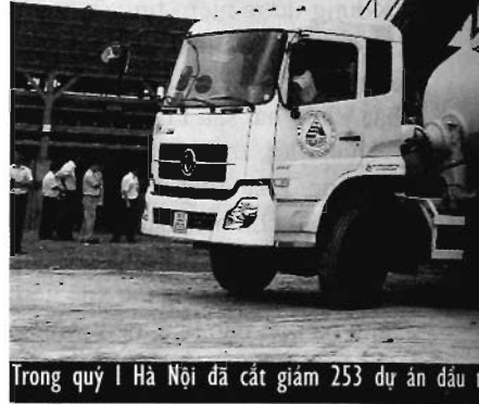
Trong quý I Hà Nội đã cắt giảm 253 dự án đầu

Hà Nội đã hoàn thành phương án cắt giảm, đình hoãn, giãn tiến độ của 253 dự án, với tổng kinh phí cắt giảm là 813,374 tỷ đồng và đang báo cáo xin ý kiến chỉ đạo của Chính phủ. Đáng lưu ý là, phần vốn ngân sách thành phố điều chỉnh giảm từ các dự án phải dừng triển khai, đình hoãn, giãn tiến độ sẽ được điều chuyển bổ sung nguồn vốn để phục vụ công