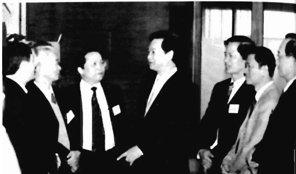
Thủ tướng Nguyễn Tấn Dũng trao đổi với lãnh đạo các tỉnh, TP bên lề hội nghị