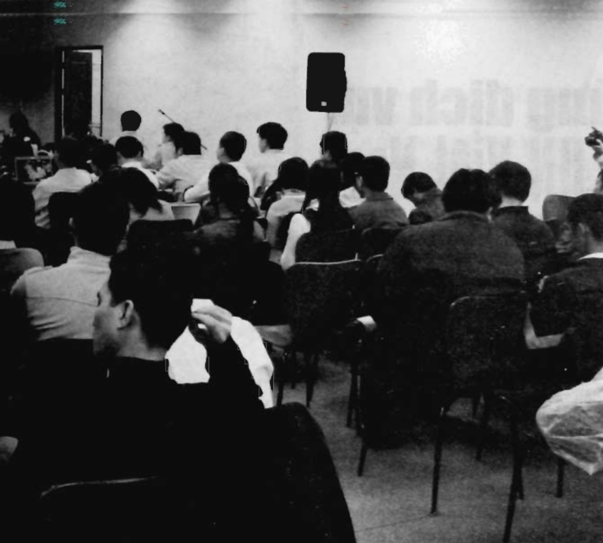
Các chuyên gia dự án PIT họp bàn kế hoạch mở rộng triển khai ứng dụng

quản lý thuế TNCN đang dồn lực chuẩn bị cho công tác triển khai thí điểm, đào tạo người sử dụng và triển khai toàn quốc. Công tác chuẩn bị được chia thành các nội dung công việc: chuẩn bị môi trường triển khai; chuyển đổi dữ liệu; mở giao diện với hệ thống khác; chuẩn bị tài liệu đào tạo.