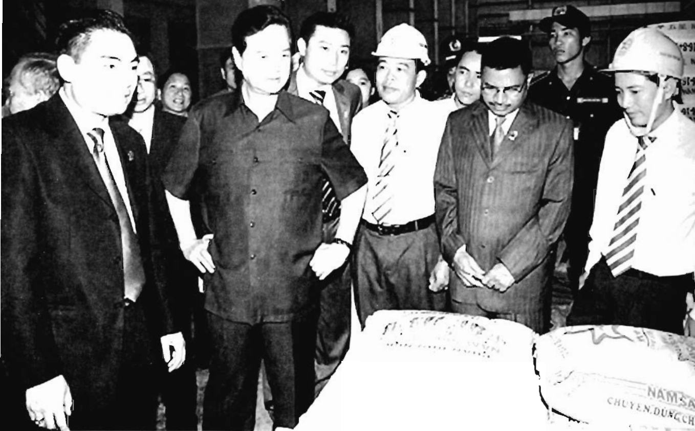
Thủ tướng Nguyễn Tấn Dũng thăm Nhà máy Phân đạm Năm Sao