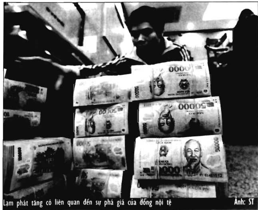
Lạm phát tăng có liên quan đến sự phá giá của đồng nội tệ