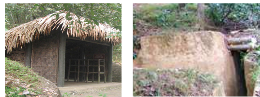
Hình 3. Lán, hầm hào có kiến trúc hài hòa với thiên nhiên

Về mặt thẩm mỹ: Với các di tích phục hồi nguyên gốc cần tạo một không gian kiến trúc mộc mạc, đơn sơ, sử dụng hệ kết cấu chịu lực (khung, cột, xà) dùng thép ống bọc Compozit, giả vật liệu tương ứng. Vách liếp, dui mè, lá cọ lợp mái qua ngậm tâm thuốc chống mối mọt và phủ bề mặt Compozit tạo cảm giác gần gũi và có độ bền cao.