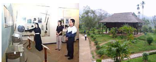
Hình 5. Nhà trưng bày khai thác kiến trúc nhà sàn

Trong công trình kiến trúc: Khai thác kiến trúc đặc trưng của vùng như kiến trúc nhà sàn, nhà đất, chi tiết, màu sắc công trình. Xác định quy mô, khối tích hài hòa với cảnh quan chung của khu vực.