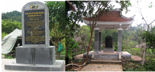
Hình 4. Nhà bia, bia ghi dấu sự kiện