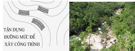
Hình 6. Khai thác địa hình tự nhiên

rộng, tận dụng địa hình để xây dựng công trình. Mật độ, khối tích và chiều cao công trình phải giảm dần về phía di tích .