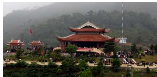
Hình 7. Khai thác kiến trúc dân tộc

Về mặt kiến trúc khai thác các đường nét của kiến trúc địa như kiến trúc kiểu nhà sàn mái dốc lợp ngói hoặc lợp dạ, không sử dụng mái tôn, nhôm kính, nên sử dụng màu màu vàng sáng, nâu nhạt.