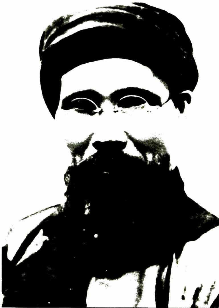
PHAN BỘI CHÂU (1867 - 1940)