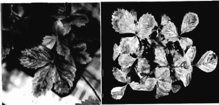
Hình 1. Cây Dầu tây bị bệnh SCV (trái), cây Dầu tây bị bệnh SMYEV (phải).