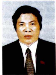
Đồng chí Nguyễn Bá Thanh Bí thư Thành ủy thành phố Đà Nẵng - Chủ tịch Hội đồng nhân dân thành phố Đà Nẵng

Nằm ở vị trí trung độ của đất nước, Đà Nẵng có vị trí trong yếu cơ về kinh tế - xã hội và quốc phòng - an ninh, đầu mối giao thông quan trọng về đường bộ, đường sắt, đường biển và đường hàng không, đồng thời là cửa ngõ chính ra biển Đông của các tỉnh miền Trung, Tây Nguyên và các nước tiểu vùng Mê Kông, Đà Nẵng đang chứa đựng nhiều tiềm năng và lợi thế để bứt phá trong công cuộc công nghiệp hoá, hiện đại hoá đất nước.