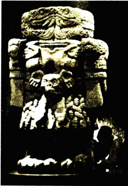
Điêu khắc hỗn hợp

Hoạt động kinh tế chính của người Maya là nông nghiệp sản