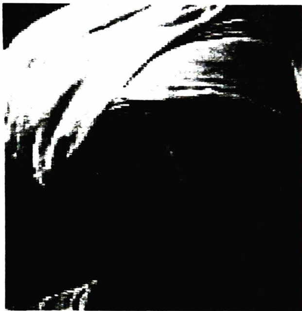
Chân dung một người đàn ông Ai Cập

khối Ả Rập. Diện tích 1.001.400 km 2 . Ai Cập nằm trên bờ sông Nil.