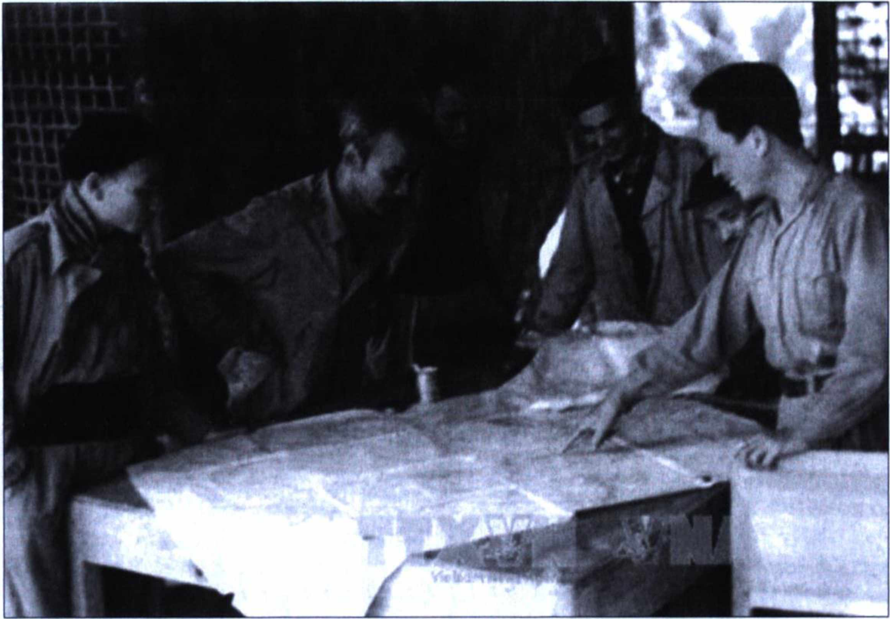
CHỦ TỊCH HỒ CHÍ MINH, ĐẠI TƯỚNG VÕ NGUYÊN GIÁP (NGOÀI CÙNG BÊN PHẢI) CÙNG CÁC ĐỒNG CHÍ TRONG THƯỜNG VỤ TRUNG ƯƠNG ĐĂNG BÀN KẾ HOẠCH MỞ CHIẾN DỊCH BIÊN GIỚI, NĂM 1950.