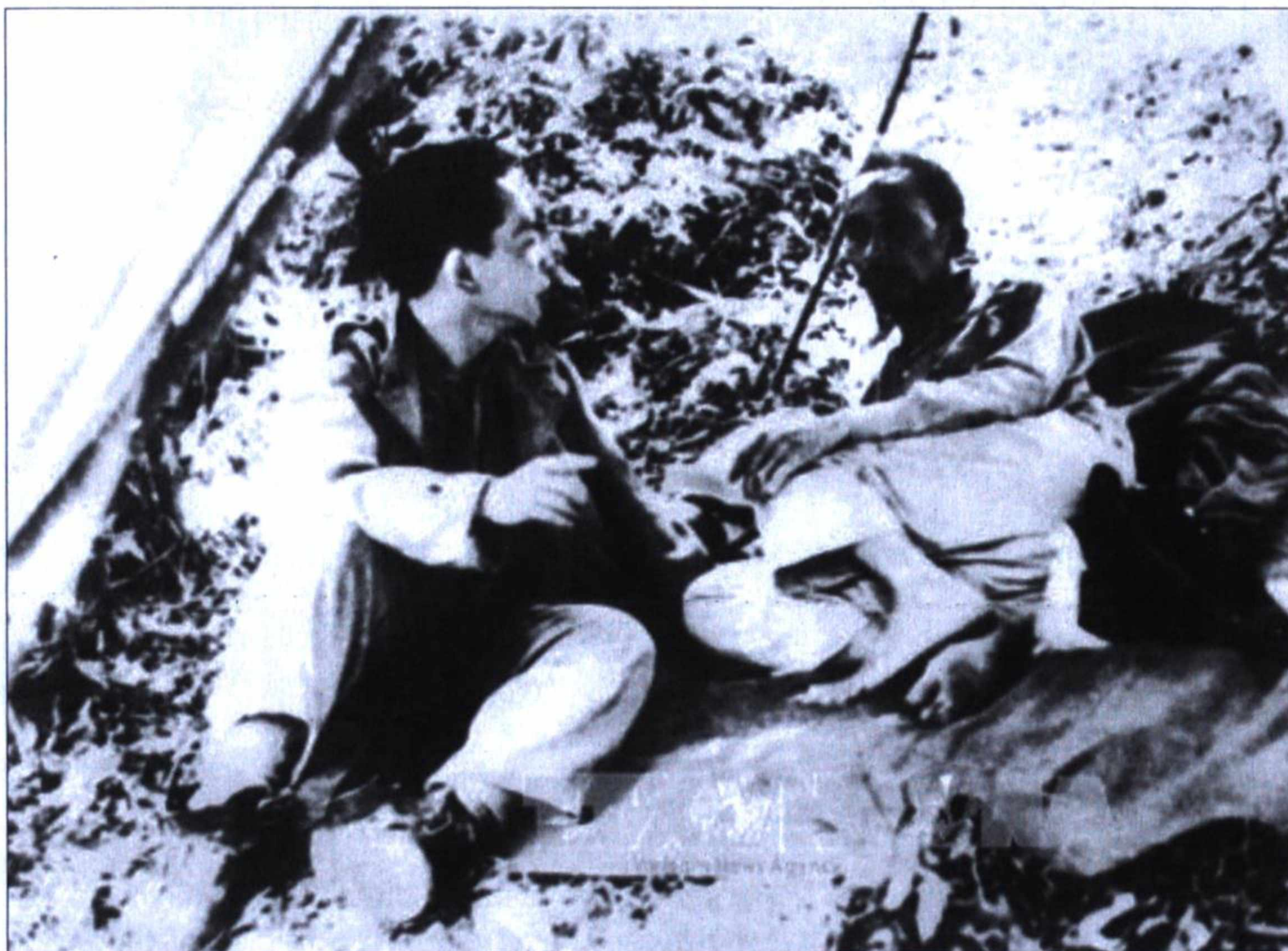
BÁC HỒ VÀ ĐẠI TƯỚNG VÕ NGUYÊN GIÁP TẠI MẶT TRẬN ĐÔNG KHÊ (LẠNG SƠN) NĂM 1950