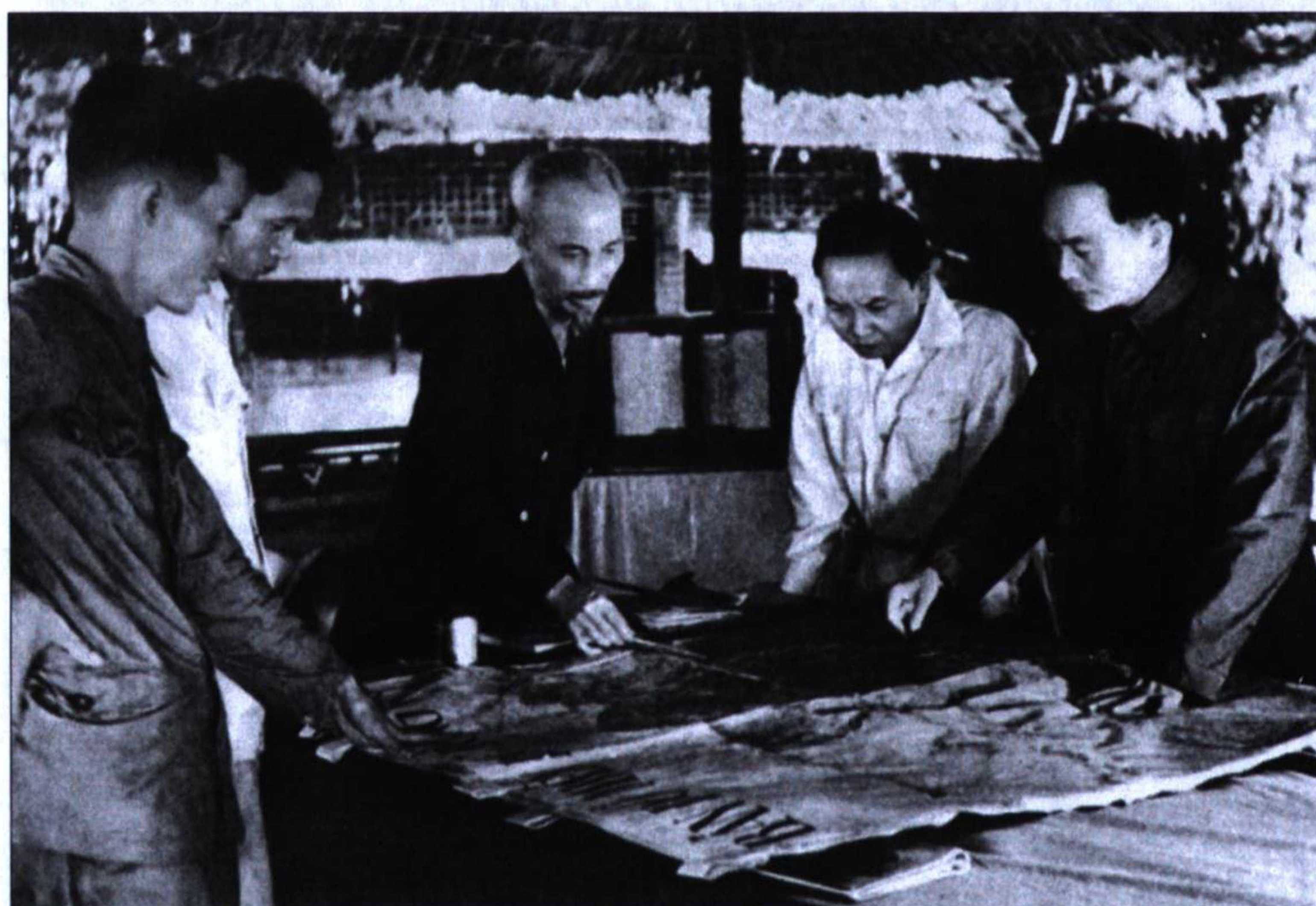
VÀO NGÀY 6/12/1953, TẠI VIỆT BẮC, CHỦ TỊCH HỒ CHÍ MINH CÙNG CÁC ĐỒNG CHÍ TRƯỜNG CHINH (BÊN TRÁI CHỦ TỊCH), PHẠM VĂN ĐỒNG (BÊN PHẢI CHỦ TỊCH), VÕ NGUYÊN GIÁP (NGOÀI CÙNG BÊN PHẢI) QUYẾT ĐỊNH MỞ CHIẾN DỊCH ĐIỆN BIÊN PHỦ.