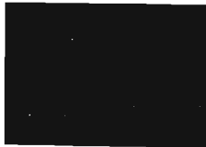
Bộ công cụ phần cứng TUHOC với các mô đun cơ bản

Triển khai chương trình giáo dục STEM kết hợp với phương pháp giáo dục "học qua hành", Công ty cổ phần công nghệ DTT đã phát triển một nền tảng phần cứng nguồn mở là nền tảng TUHOC. Nền tảng TUHOC bao gồm các mô đun phần cứng và thư viện phần mềm được thiết kế dựa trên nền tảng phần cứng nguồn mở Arduino đang rất thịnh hành trên thế giới. Với nền tảng phần cứng mở này, DTT đã phát triển chương trình giáo dục với môn học mang tên 'Sáng tạo đồ vật thông minh'.